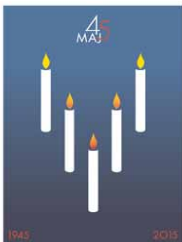
MINDELUNDEN I RYVANGEN 4. MAJ 2015

Læs mere om 4. maj i Mindelunden på www.mindelunden-4maj.dk