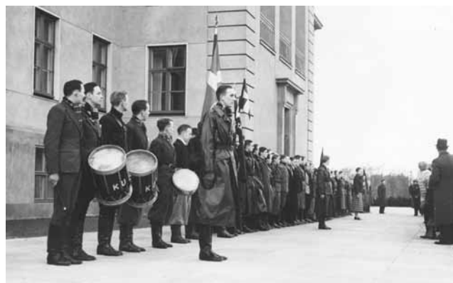
Gentofte Kommunes KU's nytårsparade januar 1938.

Svaret er, at det kunne de heller ikke. Sideløbende med den politiske debat i Danmark var aviserne fyldt med foruroligende meldinger om uro i Sønderjylland. Den 31. januar 1933 var Adolf Hitler kommet til magten i Tyskland,